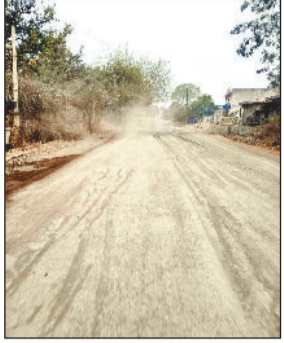
उड़ते धूल से दुकानदार व आवागमन करने वाले हैं परेशान

सरसीवा से सरायपाली मुख्य मार्ग सड़क का काम संबंधित ठेकेदार ने काम तो चालू तो करा दिया है, लेकिन पानी का छिड़काव करना भूल जा रहे हैं। जिससे उड़ते धूल से सरसीवा से सरायपाली मुख्य मार्ग पर आने वाले लोगों को धूल की वजह से खासी परेशानी का सामना कर अपने मंजिल तक पहुंचना हो रहा है। जबकि सरसीवा से सरायपाली सड़क मार्ग बनने का टेंडर हो गया है जहाँ टेंडर मिलने वाले ठेकेदार द्वारा सड़क निर्माण कार्य का काम चालू कराया गया है। मुख्य मार्ग पर बीच-बीच में उबड़ खाबड़ गड्ढों पर बिछे डस्ट के उड़ते धूल से वाहन चालको व राहिंगरो को सांस लेने में परेशानी हो रही है।